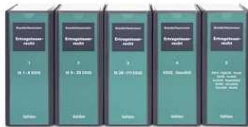
Brandis / Heuermann