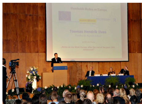
(Toomas Hendrik Ilves)

Ein letzter Höhepunkt war die Rede des Präsidenten der Republik Estland Toomas Hendrik Ilves im Oktober über „Melos on my Mind: Europe After the End of the Post 1991 Settlement“. Präsident Ilves verglich Estland mit der kleinen Insel Melos, die während des Peloponnesischen Krieges ihre Neutralität erklärte und dann von den Athenern versklavt wurde. Dieser Bezug wurde auch bei einem fehlenden Machtgleichgewicht zwischen Georgien und dem mächtigen Nachbarn Russland hergestellt. Die Forderung lautete, dass jedes Land die Freiheit haben müsse selbst zu entscheiden, ob es zur EU, NATO, GUAM oder CIS gehören wolle, sofern es die jeweiligen Anforderungen erfülle.