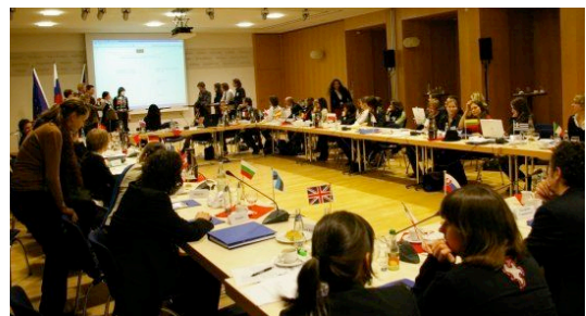
(MEUC WS 2007/2008 Sitzungsplenum, in der Landesvertretung von Sachsen-Anhalt)

Das WHI hat im Wintersemester 2007/2008 eine Simulation des Europäischen Rates zu dem Thema „ For a European Climate Strategy - Perspectives and Goals after Bali “ durchgeführt. Hierzu haben die Studierenden jeweils die Positionen der einzelnen Mitgliedstaaten und der Europäischen Kommission vorbereitet, in enger Anlehnung an das, was aus Presse und von den Botschaften der betreffenden Länder über die tatsächliche politische Diskussion im Lande in Erfahrung zu bringen war. Das Ziel der MEUC ist es, die Studierenden die Schwierigkeiten der Konsensfindung im Europäischen Rat praktisch erleben zu lassen.