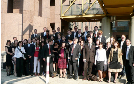
(MEUC SS 2008, vor dem EuGH)

Im Sommersemester 2008 fand eine Simulierungsübung zur Arbeit des Europäischen Gerichtshof (EuGH) zu dem Thema „ Der Rechtsstatus des Rechtsanwalts im Europäischen Gemeinschaftsrecht: Wettbewerbsrechtliche Untersuchungen der Europäischen Kommission vs. Anwaltliche Verschwiegenheitspflicht “ statt. Im Rahmen der Exkursion „Europa vor Ort“ konnte die zentrale Veranstaltung der Simulation (mündliche Verhandlung) in einem Sitzungssaal des Gerichtshofs