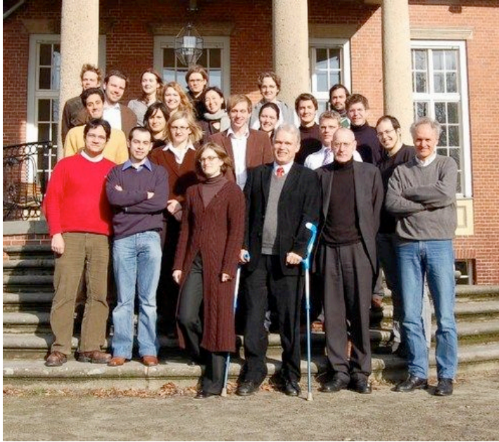
(Einführungsseminar im Wannsee-Forum, 2007)

Das Berliner Graduiertenkolleg „Verfassung jenseits des Staates: Von der europäischen zur globalen Rechtsgemeinschaft?“ – „Multilevel Constitutionalism: European Experiences and Global Perspectives“ ist Fragen