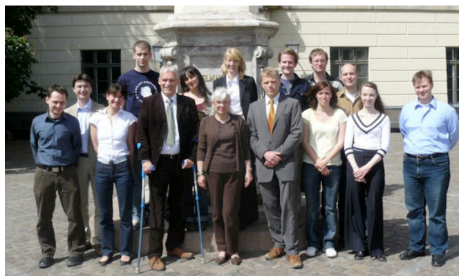
(Mitarbeiter des Lehrstuhls)