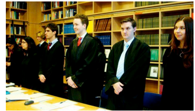
(MEUC WS 2008/09, in der WHI Bibliothek)

Im Wintersemester 2008/2009 fand erneut eine Simulation des EuGH statt, diesmal zu dem Thema „ Der Grüne Punkt: Wettbewerbsrecht vs. Markenrecht vor dem EuGH “.